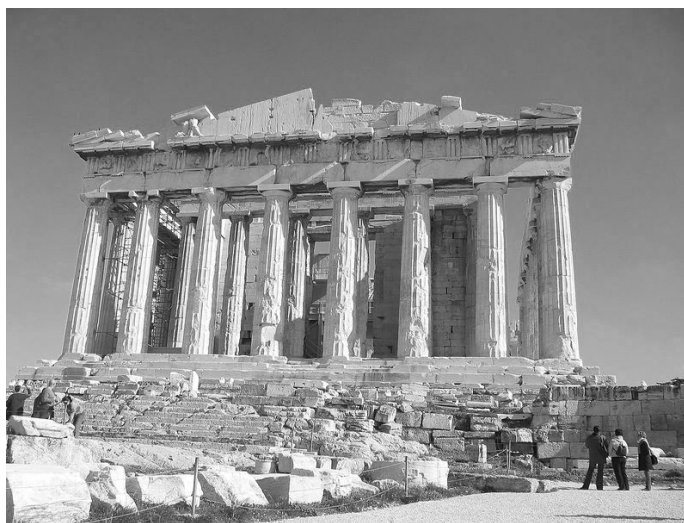
Partenón de Atenas. Imagen bajo licencia CC.

Gráfico 1: Observa la siguiente fotografía del Partenón y responde a las siguientes preguntas.