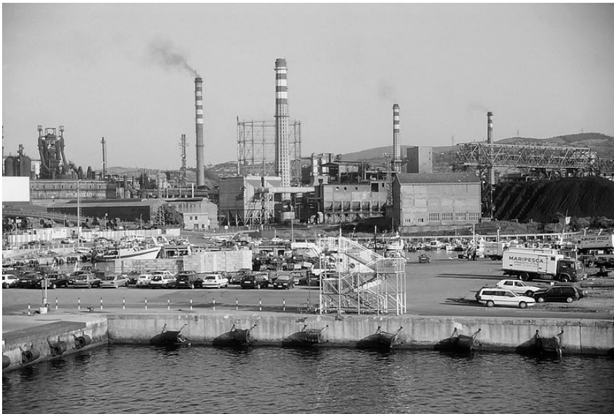
Industria en Piombino, Italia.