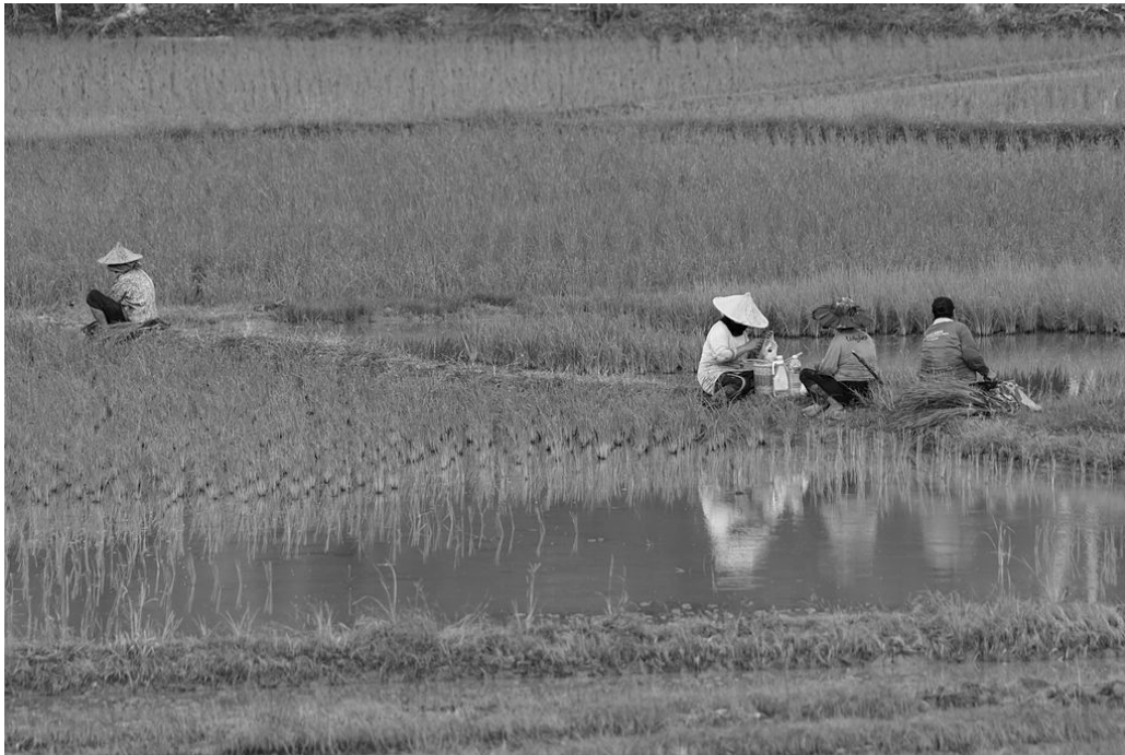
Cultivo de arroz en Asia. Imagen en Wikimedia commons de dominio público

Información gráfica 2: Observa la siguiente imagen y responde a las preguntas que te proponemos a continuación: