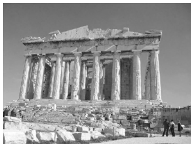
Partenón de Atenas. Imagen bajo licencia CC.

Gráfico 1: Observa la siguiente fotografía del Partenón y responde a las siguientes preguntas.