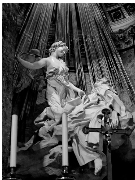
Imagen bajo licencia CC

Información gráfica 1: Observa la obra de Bernini “El éxtasis de Santa Teresa” y responde a las preguntas que se plantean a continuación.